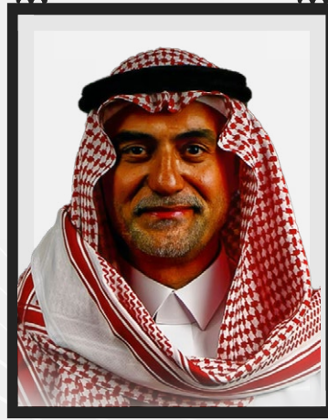
سالم المسرحي المؤسس

الفكر ثروة، والاستثمار الحقيقي رحلة طويلة